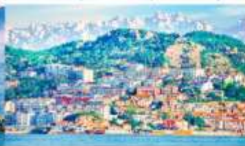
หมู่บ้านชาวประมงซาจื่อโข่ว