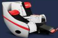
**อพเทค ณ วันที่ 26/02/67**