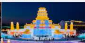
เทศกาลคอมไฟน้ำแข็ง