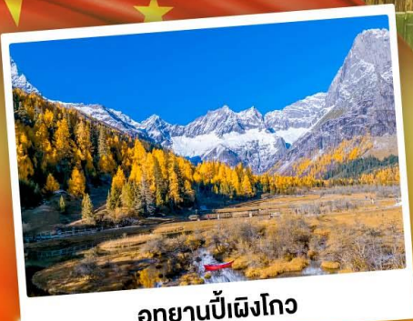
อุทยานปี้ฝิงโกว