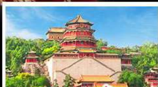
พระราชวังฤดูร้อนอี่เหอหยวน