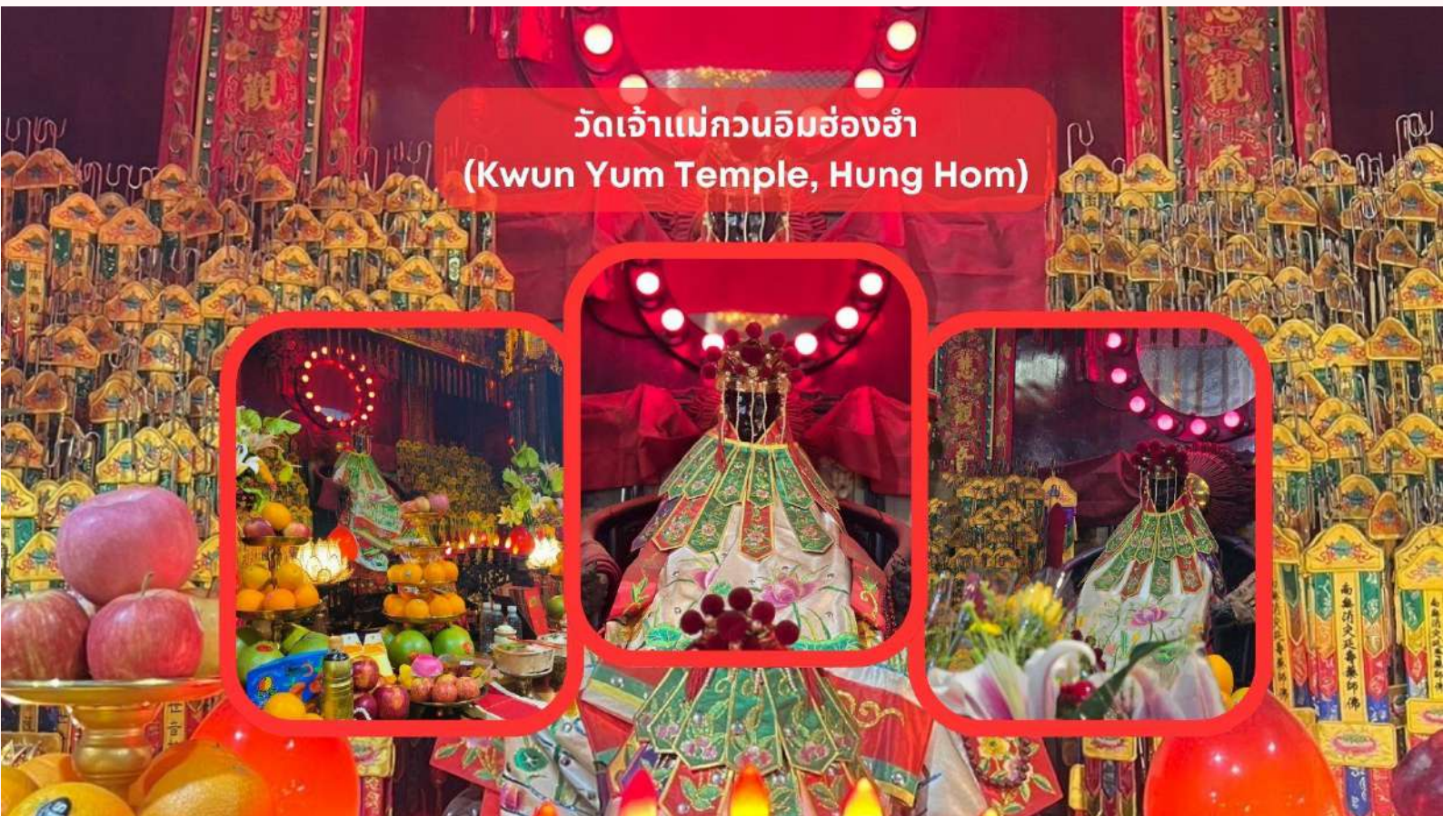
วัดเจ้าแม่กวนอิมฮ่องฮำ (Kwun Yum Temple, Hung Hom)

ฮ่องกง เมืองแห่งสีสันและวัฒนธรรมที่ไม่เคยหลับใหล เป็นเมืองที่เต็มไปด้วยพลังและชีวิตชีวา