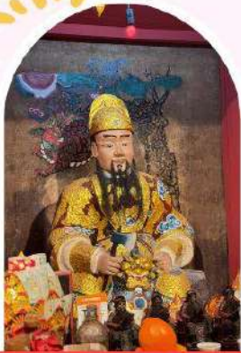
วัดเขกงองค์เก่าแก่ 600 ปี หยุนหลง

"ไหว้พระ เสริมดวง เพิ่มสิริมงคลแก่ชีวิต"