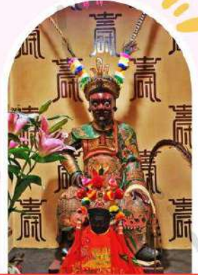
วัดเขกงองค์เก่าแก่ 400 ปี ไซกง