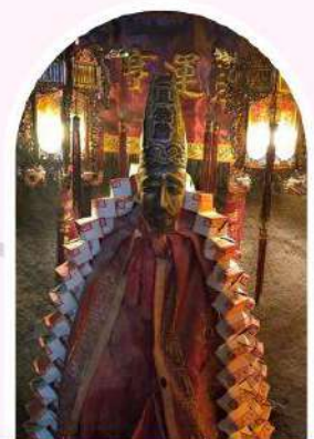
วัดหลินฟ้า โชคลากและความมั่งคั่ง