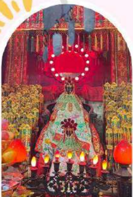
วัดเจ้าแม่กวนอิมฮ่องฮ่า ขอพรเรื่องเงิน ทรัพย์สิน และความมั่งคั่ง