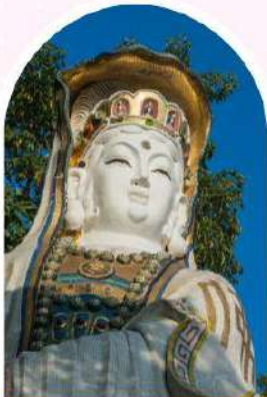
ริพลัสเบย์ รับพลังงานดี เสริมพลังฮวงจุ้ย