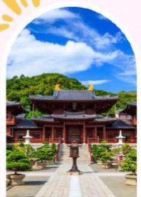
วัดนางชีฉีหลิน สวนหนานเหลียน