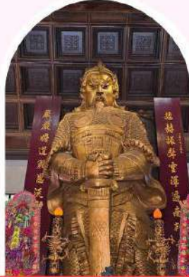
วัดเขกง ซาถึน ขอพรโชคลาก การเงิน และธุรกิจ