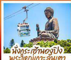
นั่งกระเช้าแองปิง พระใหญ่เกาะคนีตา