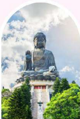
นั่งกระเชานองปิง นมัสการพระใหญ่โป่วหลิน