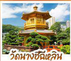
วัดนางชีฉีฉีลิน