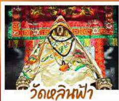
วัดเขลินฟ้า