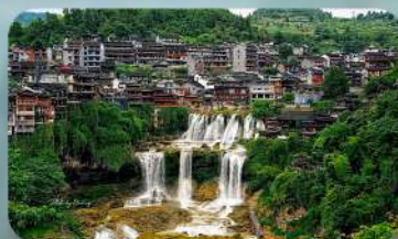
หมู่บ้านฟุ่หลงเจิ้น