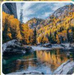
เคอเคอทัวไห่