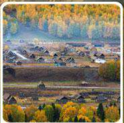
หมู่บ้านเหมู่

สวรรค์ใบไม้เปลี่ยนสี เขื่อนคานาสีอแดนฟัน มหัศจรรย์หมู่บ้านเหมู่ เเคอเคอทัวให้อัจฉรัยภูผาหิน