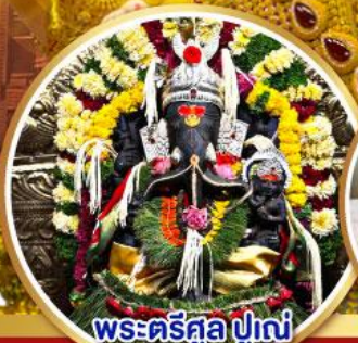
พระตรีศูล ปูเณ (Trishul Pune)