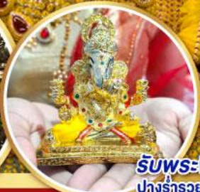
รับพระพิฆเนศ ปางรำรอย ท่านละ 1 องค์