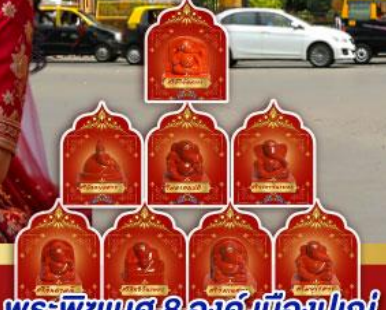
พระพิฆเนศ 8 องค์ เมืองปูเณ