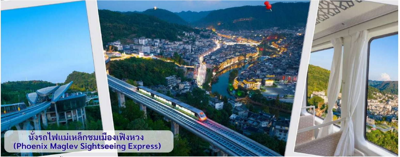
นั่งรถไฟแม่เหล็กชมเมืองเฟิงหวง (Phoenix Maglev Sightseeing Express)

จากนั้นนำทุกท่าน เดินถนนโบราณ Feng Hueng Ancient Town ที่ถนนช้อปปิ้ง Shibanshi Street เมืองที่ยังคงรักษาเอกลักษณ์ความเป็นพื้นเมืองผสมผสานกับยุคปัจจุบันเอาไว้ได้อย่างลงตัววิถีชีวิตของชาวบ้านที่อาศัยอยู่ที่นี่ บรรยากาศในเมืองเฟิงหวง ถนนเก่าช้อปปิ้งเป็นถนนปูหินแคบๆ กว้างไม่ถึง 5 เมตร ทอดยาวจากทางเข้าวัดเต้าเหมินไปทางทิศตะวันตก ผ่านถนนหลายสาย ได้แก่ ถนนคอรอส ถนนเจิ้งตะวันออก ถนนเจิ้งตะวันตก ศาลาสูยหลง หียงเซียวชง เต้าซานลา ศาลาเจี้ยกัว และสุสานเซินฉงเหวิน สุดท้ายจะนำไปสู่ “น้ำพุแรกใต้ฟ้า” ถนนสายนี้มีความยาวกว่า 3,000 เมตร และเป็นย่านการค้าที่คึกคักที่สุดในเฟิงหวง