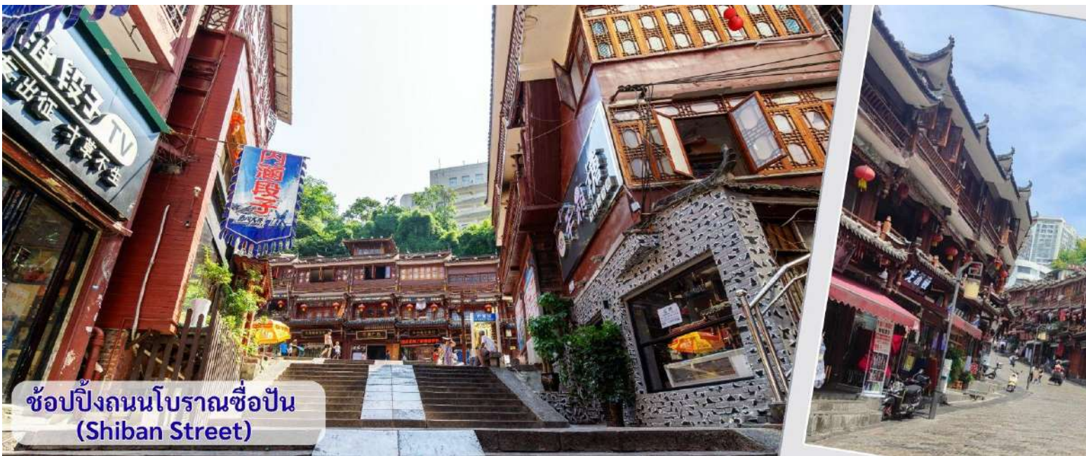
ช้อปปิ้งถนนโบราณช้อปปิ้ง (Shibanshi Street)

จากนั้นนำทุกท่าน เดินถนนโบราณ Feng Hueng Ancient Town ที่ถนนช้อปปิ้ง Shibanshi Street เมืองที่ยังคงรักษาเอกลักษณ์ความเป็นพื้นเมืองผสมผสานกับยุคปัจจุบันเอาไว้ได้อย่างลงตัววิถีชีวิตของชาวบ้านที่อาศัยอยู่ที่นี่ บรรยากาศในเมืองเฟิงหวง ถนนเก่าช้อปปิ้งเป็นถนนปูหินแคบๆ กว้างไม่ถึง 5 เมตร ทอดยาวจากทางเข้าวัดเต้าเหมินไปทางทิศตะวันตก ผ่านถนนหลายสาย ได้แก่ ถนนคอรอส ถนนเจิ้งตะวันออก ถนนเจิ้งตะวันตก ศาลาสูยหลง หียงเซียวชง เต้าซานลา ศาลาเจี้ยกัว และสุสานเซินฉงเหวิน สุดท้ายจะนำไปสู่ “น้ำพุแรกใต้ฟ้า” ถนนสายนี้มีความยาวกว่า 3,000 เมตร และเป็นย่านการค้าที่คึกคักที่สุดในเฟิงหวง