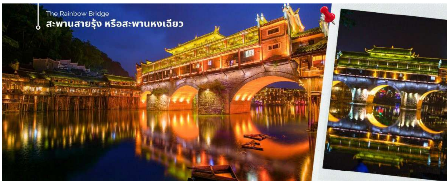
The Rainbow Bridge

นำท่านชม สะพานสายรุ้ง (The Rainbow Bridge) หรือสะพานหงเจียว เป็นสะพานไม้โบราณที่มีหลังคาคลุมเหมือนสะพานข้ามคลองในเวนิส ตั้งอยู่ในเมืองเฟิ่งหวาง จุดเด่นอีกแห่งหนึ่งที่อยู่ใกล้สะพานนี้ก็คือ บ้านบริเวณที่สะพานหงเจียว จยกพื้นสูงเรียงรายกันบนริมน้ำที่ใสสะอาดจนเห็นกันบึง ซึ่งเป็นทัศนียภาพที่สวยงาม ที่ทั้งชาวจีนและชาวต่างประเทศนิยมเดินทางมาเที่ยวชมที่นี่ ชมแสงสียามค่ำคืนของเมืองเก่า จุดไฮไลท์ที่ขึ้นชื่อของเมืองแห่งนี้