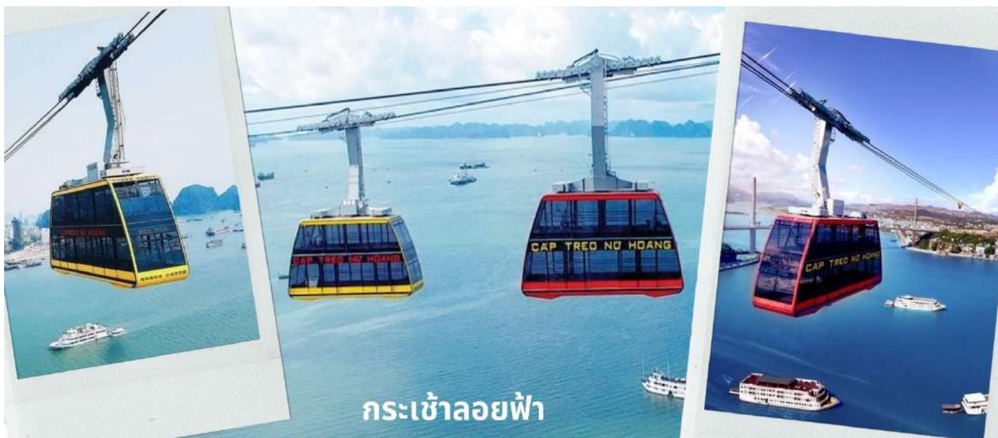
กระเช้าลอยฟ้า

จากนั้นนำท่านนั่ง Queen Cable Car กระเช้าลอยฟ้า 2 ชั้นที่ใหญ่ที่สุดในโลก จุคนได้มากถึง 250 คนต่อเที่ยว สามารถรับ-ส่งผู้โดยสารได้มากถึง 2,000 คนต่อชั่วโมง กระเช้าลอยฟ้า 2 ชั้นยิ่งใหญ่อลังการนี้เป็นส่วนหนึ่งของ สวนสนุก Sun World Halong Park สร้างโดย Doppelmayr/Garaventa Group จากประเทศสวิตเซอร์แลนด์ และออสเตรีย โดยมีความพิเศษที่สามารถทำลายสถิติโลก และได้รับการบันทึกลงใน Guinness World Records ถึง 2 รายการ คือ เป็นกระเช้าที่จุคนได้มากที่สุดในโลก และมีเสาคอนกรีตส่งกระเช้าที่สูงที่สุดในโลก ด้วยความสูงถึง 188.88 เมตร