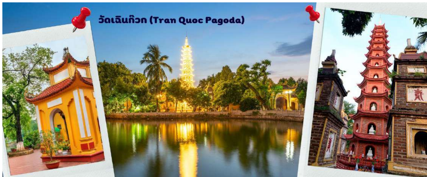
วัดเจดีย์กว (Tran Quoc Pagoda)

เห็นสิ่งปลูกสร้างสไตล์จีน และเจดีย์หลายชั้นโดดเด่น มีภาพที่สะท้อนลงสู่ผืนน้ำ เป็นภูมิทัศน์ที่งดงามทั้งยามกลางวันและยามค่ำคืนที่มีการเปิดไฟส่องสว่าง