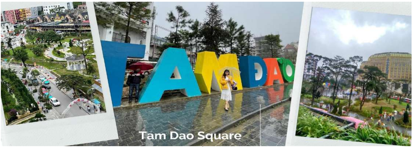
Tam Dao Square

นำท่านถ่ายรูปกับ โบสถ์หินตามด้าว สร้างขึ้นเมื่อปี ค.ศ. 1906 เดิมเป็นบ้านไม้เล็กๆ แต่ต่อมามีการบูรณะปรับปรุงในปี ค.ศ. 1937 ให้มีความแข็งแรง ด้วยการใช้หิน โดยสร้างแบบสถาปัตยกรรมโกธิก และได้รับการอนุรักษ์เอาไว้เป็นอย่างดีจนกลายเป็นสถานที่ท่องเที่ยวอย่างในปัจจุบัน ด้านในตกแต่งอย่างเรียบง่ายด้วยหน้าต่างโค้งหลายบาน ประดับด้วยโมเสกแก้วที่เล่าเรื่องราวเกี่ยวกับพระเยซูคริสต์ และเป็นโบสถ์ที่ไม่มีเสาตั้งเด่นอยู่ตรงกลางเหมือนโบสถ์อื่นๆ บริเวณรอบๆ โบสถ์มีพื้นที่ที่สามารถมองเห็นวิวเมือง ตามด้าว ได้ทั้งเมืองเลย