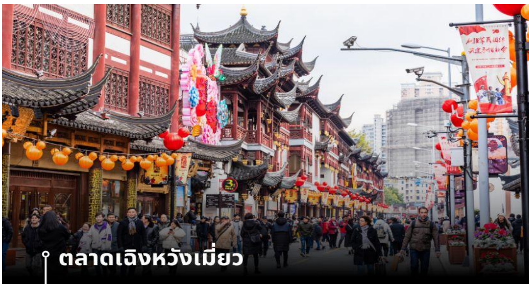
📍 ตลาดเจิ้งหวังเมี่ยว

นำท่านอิสระช้อปปิ้ง Florentia Village Outlet ห้างเอาท์เล็ตส์ขนาดใหญ่ที่รวบรวมแบรนด์แฟชั่นชั้นนำต่างๆ มากมายให้ท่านเลือกช้อปปิ้งไม่ว่าจะแบรนด์ BALENCIAGA, GUCCI, BALENCIAGA, GUCCI, GUESS, PRADA, SAINT LAURENT PARIS, BURBERRY, ADIDAS, CONVERSE และอีกมากมาย ให้ท่าน ช้อปปิ้ง เป็นของฝากแก่ญาติสนิท มิตรสหาย และที่นี่เป็นมากกว่าการช้อปปิ้ง เพราะที่นี่มีเมืองจำลองในอิตาลีที่มีลำคลองและเรือกอนโดลาและสถาปัตยกรรมยุโรปคลาสสิกจำลองสามารถถ่ายรูปเช็คอินสไตล์ยุโรปได้อีกด้วย