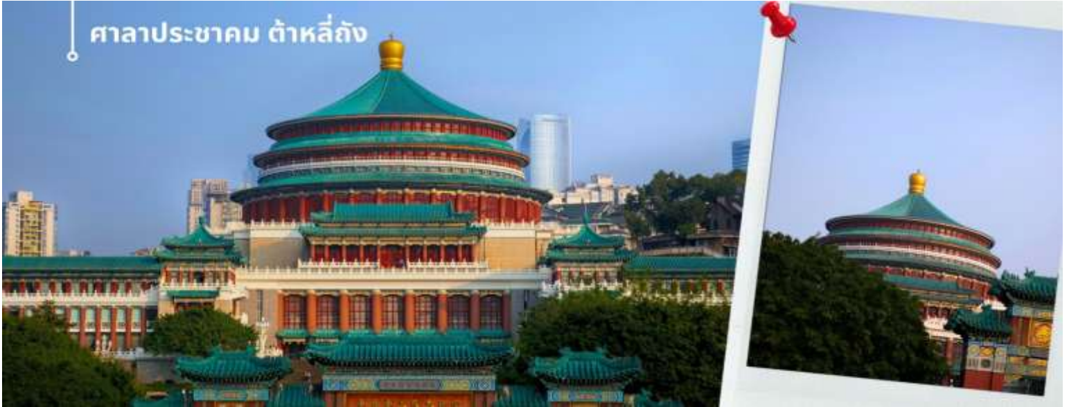
ศาลาประชาชน ต้าหลี่ถิง