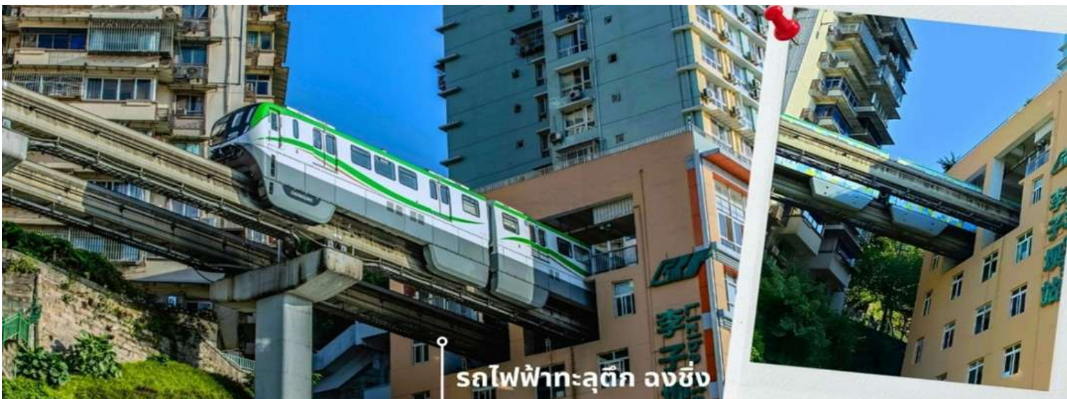
รถไฟฟ้าทะเลตึก ฉงชิ่ง

จากนั้นนำท่านนั่งรถไฟฟ้าทะเลตึก หรือ สถานี Liziba เป็นสถานีรถไฟแบบขานชาลา สิ่งที่ทำให้สถานี Liziba มีชื่อเสียงไปทั่วโลกคือ “เส้นทางรถไฟที่วิ่งทะลุผ่านอาคารสูง 19 ชั้น” โดยมีระบบลดเสียงและแรงสั่นสะเทือน ทำให้ผู้ที่อาศัยอยู่ในตึกไม่ได้รับผลกระทบจากเสียงดังมาก กลายเป็นภาพอันน่าตื่นตาตื่นใจของผู้ที่มาเยือนทั้งนักท่องเที่ยวที่เดินทางมาเป็นครั้งแรก ผู้โดยสารบนขบวนรถไฟและผู้เข้าชมจากจุดชมวิวก็ต่างตื่นเต้นไปตามๆกันกับการที่ได้เห็นรถไฟวิ่งทะลุตึกนี้ สถานี Liziba ได้รับการยกย่องให้เป็น 1 ในสถานที่สำคัญที่สะท้อนความเติบโตของจีนตลอด 70 ปี ซึ่งไม่ได้เกิดขึ้นโดยบังเอิญ รถไฟฟ้าทะเลตึกนี้คือตัวอย่างของความอัจฉริยะในการออกแบบการคมนาคมในเมืองภูเขาแห่งนี้ให้ท่านได้สัมผัสประสบการณ์กับการขึ้นนั่งบนรถไฟเพื่อผ่านทะเลตึกและเก็บภาพบรรยากาศ