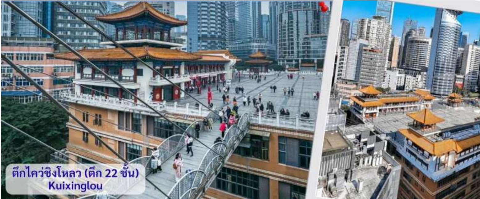
ตึกไควซิงโหลว (ตึก 22 ชั้น) Kuixinglou

จากนั้นอิสระถ่ายรูปหน้าตึกตะเกียบ ฉงชิ่ง(ด้านนอก) คือ ฉงชิ่งกั๋วไท่อาร์ตเซ็นเตอร์ (Chongqing Guotai Arts Center) เป็นแลนด์มาร์กสำคัญที่มีสถาปัตยกรรมคล้ายตะเกียบยักษ์สีแดงและดำวางซ้อนกัน เป็นศูนย์จัดแสดงงานศิลปะและสถานที่ท่องเที่ยวที่นิยมสำหรับการถ่ายรูป โดยเฉพาะในเวลากลางวันเมื่อเปิดไฟสวยงาม สิ่งก่อสร้างอันมีเอกลักษณ์ อาคารนี้ถูกวางโครงสร้างให้มีรูปร่างคล้ายกอง "ตะเกียบยักษ์" สีดำและแดงที่วางซ้อนกันเป็นชั้นๆ ที่ส่วนปลายของตะเกียบสีแดงจะมีตัวอักษรจีนคำว่า "กั๋ว" ประทับอยู่ ซึ่งมีความหมายถึง ชาติหรือประเทศ ส่วนที่ปลายตะเกียบสีดำ จะมีอักษรจีนคำว่า "ไท่" ประทับอยู่ ซึ่งหมายถึง ความเจียบสงบ หรือความอุดมสมบูรณ์