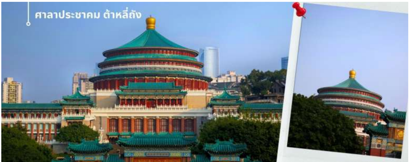
ศาลาประชาชน ต้าหลี่ถิง

นำท่านเดินทางสู่ ศาลาประชาชน (ด้านนอก) เป็นสถานที่หนึ่ง ในสัญลักษณ์ของเมืองฉงชิ่ง ด้วยสีส้มและรูปแบบการจั่ววางอย่างโดดเด่นและลงตัว มีการผสมผสานของศิลปะในยุคราชวงศ์หมิงและราชวงศ์ชิงเข้าไว้ด้วยกัน ด้านหน้าจะเป็นลานกว้างหน้า 4 CHUCKG3 ฉงชิ่ง อุ้หลง หลุมฟ้า ต้าจู้ หยงหยาดัง 5 วัน 4 คืน บิน HAINAN AIRLINES (HU) ในตอนเย็นและตอนกลางคืนจะมีผู้คนจำนวนมากเข้ามารวมตัวกันทำกิจกรรม ไม่ว่าจะเป็นการเต้นแอโรบิค เดินเล่น ปิกนิก เดินชมแสงไฟยามค่ำคืน จัดนิทรรศการต่างๆ