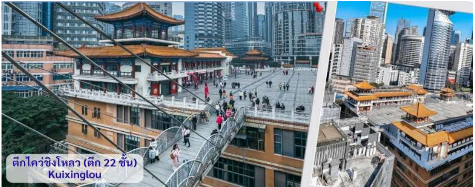
ตึกไควซิงโหลว (ตึก 22 ชั้น) Kuixinglou