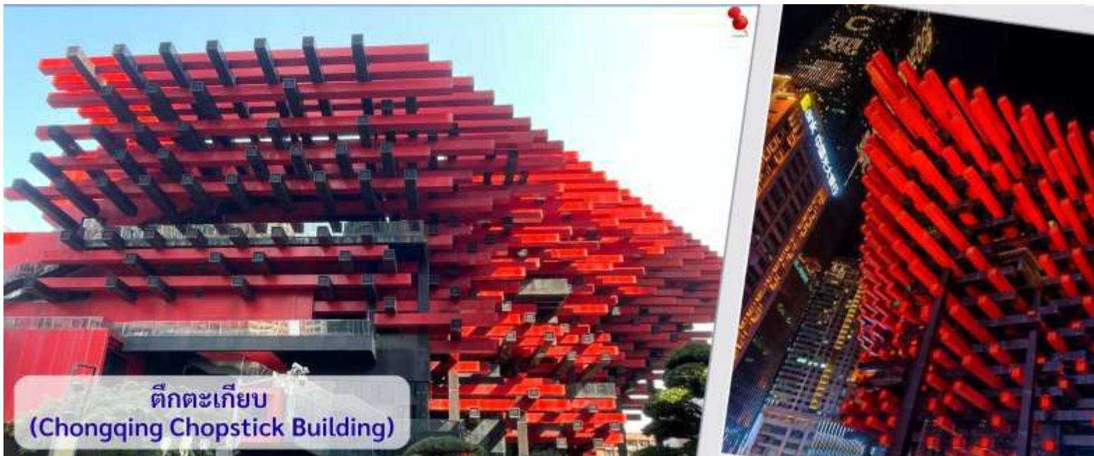
ตึกตะเกียบ (Chongqing Chopstick Building)

จากนั้นอิสระถ่ายรูปหน้า ตึกตะเกียบ ฉงชิ่ง(ด้านนอก) คือ ฉงชิ่งกั๋วไถอาร์ทเซ็นเตอร์ (Chongqing Guotai Arts Center) เป็นแลนด์มาร์กสำคัญที่มีสถาปัตยกรรมคล้ายตะเกียบยักษ์สีแดงและดำวางซ้อนกัน เป็นศูนย์จัดแสดงงานศิลปะและสถานที่ท่องเที่ยวที่นิยมสำหรับการถ่ายรูป โดยเฉพาะในเวลากลางวันเมื่อเปิดไฟสวยงาม สิ่งก่อสร้างอันมีเอกลักษณ์ อาคารนี้ถูกวางโครงสร้างให้มีรูปร่างคล้ายกอง "ตะเกียบยักษ์" สีดำและแดงที่วางซ้อนกันเป็นชั้นๆ ที่ส่วนปลายของตะเกียบสีแดงจะมีตัวอักษรจีนคำว่า "กั๋ว" ประทับอยู่ ซึ่งมีความหมายถึง ชาติหรือประเทศ ส่วนที่ปลายตะเกียบสีดำ จะมีอักษรจีนคำว่า "ไถ" ประทับอยู่ ซึ่งหมายถึง ความเจียบสงบ หรือความอุดมสมบูรณ์