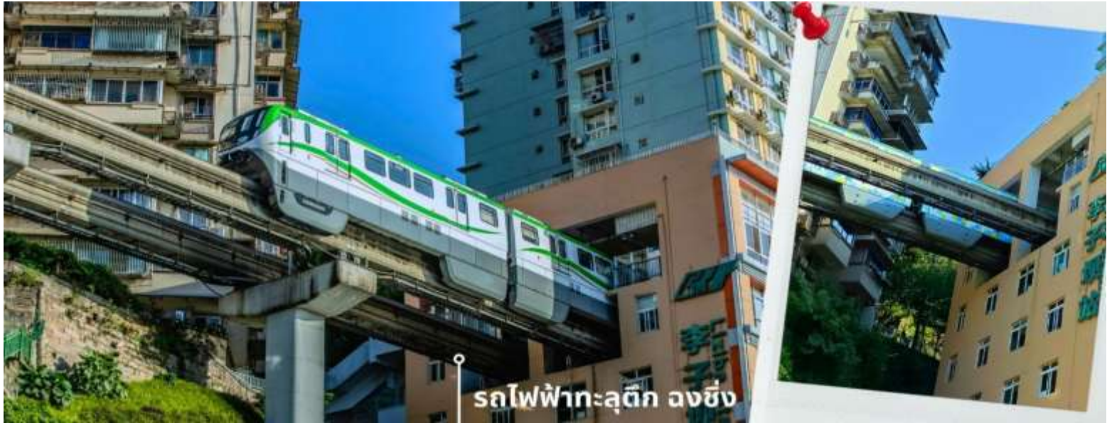
รถไฟฟ้าทะลุถึก ฉงชิ่ง

นำท่านเดินทางสู่ ศาลาประชาชน (ด้านนอก) เป็นสถานที่หนึ่ง ในสัญลักษณ์ของเมืองฉงชิ่ง ด้วยสีส้มและรูปแบบการจั่ววางอย่างโดดเด่นและลงตัว มีการผสมผสานของศิลปะในยุคราชวงศ์หมิงและราชวงศ์ชิงเข้าไว้ด้วยกัน ด้านหน้าจะเป็นลานกว้างหน้า 4 CHUCKG3 ฉงชิ่ง อุ้หลง หลุมฟ้า ต้าจู้ หยงหยาดัง 5 วัน 4 คืน บิน HAINAN AIRLINES (HU) ในตอนเย็นและตอนกลางคืนจะมีผู้คนจำนวนมากเข้ามารวมตัวกันทำกิจกรรม ไม่ว่าจะเป็นการเต้นแอโรบิค เดินเล่น ปิกนิก เดินชมแสงไฟยามค่ำคืน จัดนิทรรศการต่างๆ