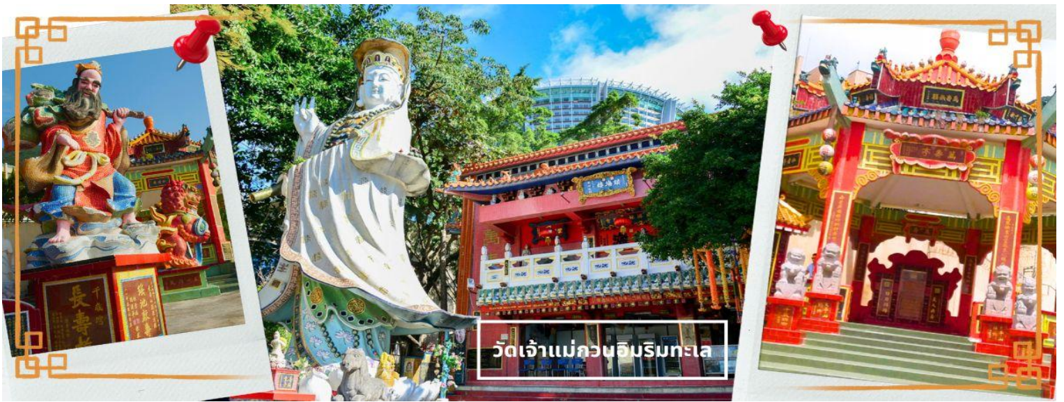
วัดเจ้าแม่กวนอิมรับทะเล

ความศักดิ์สิทธิ์ และยังมีเจ้าแม่ทับทิม หรือเทพธิดาแห่งท้องทะเลองค์ใหญ่ ซึ่งคนฮ่องกง คนมาเก๊า และคนจีน ที่อยู่ริมทะเล ชาวประมง นักเดินเรือหรือผู้ที่เดินทางทางเรือเป็นประจำ จะนับถือเจ้าแม่ทับทิมเป็นอย่างมาก มีความเชื่อว่าเจ้าแม่ทับทิมจะปกป้องเราจากภัยอันตรายระหว่างการเดินทาง ภายในวัดยังมีเทพเจ้าและพระพุทธรูปต่างๆ ประดิษฐานไว้มากมายตามความเชื่อถือศรัทธา เช่น เทพเจ้าไฉ่ซิงเอี้ย ไหว้ขอโชคลาภความมั่งคั่ง ความร่ำรวย, พระสังกัจจายน์ โพธิสัตว์ เทพประทาน บุตร-ธิดา ไหว้อธิษฐานขอลูก, สะพานต่ออายุ (สะพานอายุยืน) สะพานสีแดงตั้งอยู่บนริมหาด สีแดงสด เชื่อกันว่า คนจีนเชื่อกันว่าหากเดินข้ามสะพานนี้ เราจะมีอายุยืนขึ้นอีก 3 วัน (3 วัน บนสวรรค์ = 3 ปี บนโลกมนุษย์) นั่นหมายความว่า ถ้าเราเดินข้ามสะพานนี้แล้ว จะมีอายุยืนยาวขึ้นอีก 3 ปี บนโลกมนุษย์, เทพเจ้าแห่งความรัก ไหว้ขอเนื้อคู่, ศาลา 8 เหลี่ยม เชื่อกันว่าเป็นจุดที่มีดวงจืดที่ดีที่สุด ภายในศาลาแปดเหลี่ยม จุดกึ่งกลางของพื้น จะมีรูปแปดเหลี่ยม ให้เราไปยื่นขอพรจากตำแหน่งนี้เพื่อขอพลังจากสวรรค์ และอีกมากมาย