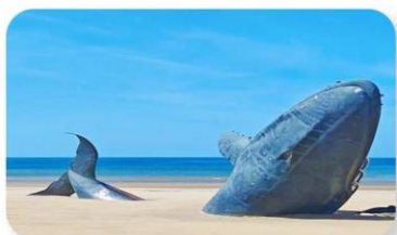
ประติมากรรมวาฬผู้โดดเดี่ยว