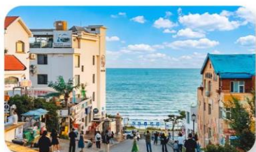
ถนนคอบเพลิงหมายเลขแปด