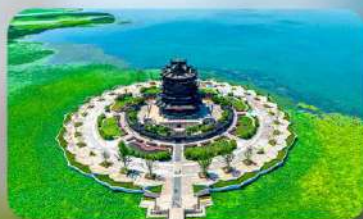
วัดหลงหยวน