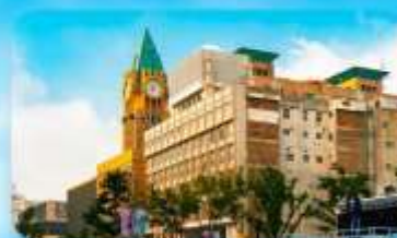
ถนนหวังฝูจิ่ง