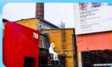
798 Art Zone