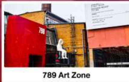
798 Art Zone