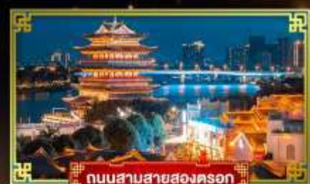
ถนนสามสายสองนครก