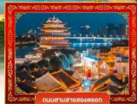
ถนนสายสองคอน