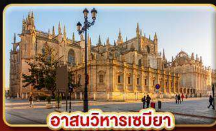
อาสนวิหารเซบิยา