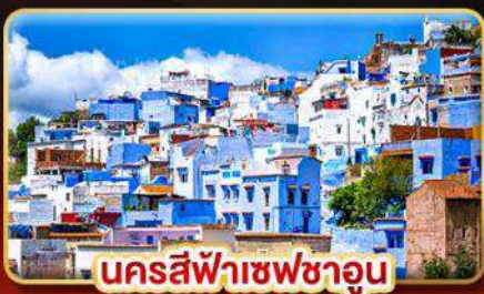
นครสีฟ้าเชฟชาอูน

📅 เดินทาง: 18-27 ต.ค. | 02-11 ธ.ค. 69 27 ธ.ค. 69 - 05 ม.ค. 70