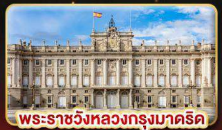
พระราชวังหลวงกรุงมาดริด