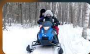
จักรยาน SNOW MOTORCYCLE