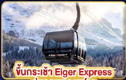
ขึ้นกระเช้า Eiger Express สู่ยอดเขาจุงเฟรา