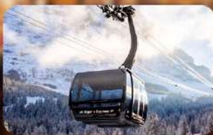
ขึ้นกระเช้า Eiger Express สู่ยอดเขาจุงเฟรา