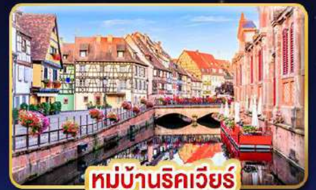
หมู่บ้านริควีแยร์