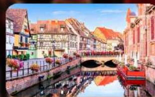
หมู่บ้านริควีเยร์