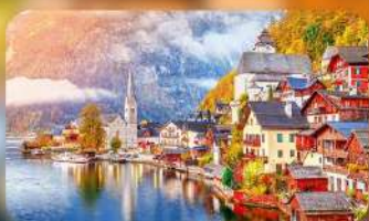
การ์นต์พิก Hallstatt / St. Wolfgang หรือริมทะเลสาบ 1 คืน