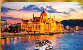
ล่องเรือแม่น้ำดานูบ ช่วง Twilight พร้อมจิบแชมเปญ