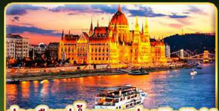
ล่องเรือแม่น้ำดานูบ ช่วง Twilight พร้อมจิบแชมเปญ

📅 เดินทาง: 02-09 ร.ค. | 06-13 ร.ค. 10-16 ร.ค. 69