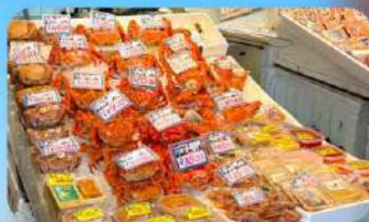
ตลาดปลาโจโก