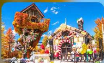
โรงงานช็อกโกแลต ชิโรอิ โคอิบิโตะ