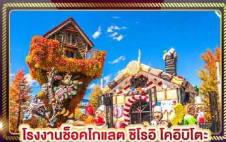
โรงงานช็อคโกแลต ชิโรอิ โคอิบิโตะ