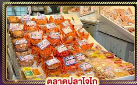
ตลาดปลาโอโก