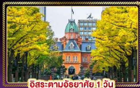
อีระตามอียาสัย 1 วัน

น้ำหนักกระเป๋า 20 Kg. บริษัทจัดหา บนเครื่องบิน