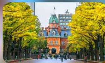
อิสระตามอัธยาศัย 1 วัน