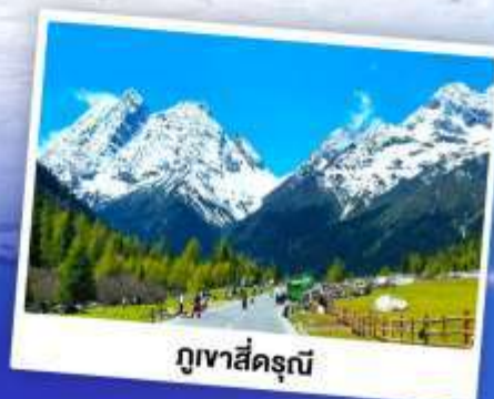
ภูเขาซีครุณี