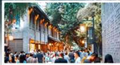
ถนนชอยกว้างชอยแควบ