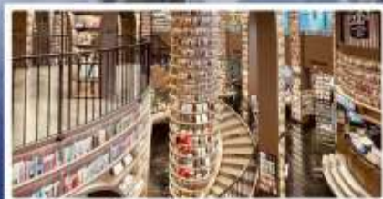
ร้านหนังสือจางซูเก่อ