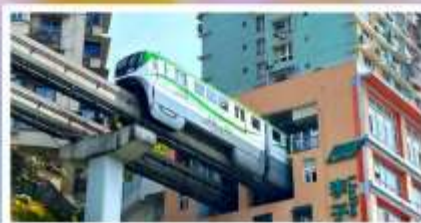
รถไฟฟ้าลัดคิว