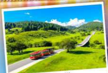
เจานางฟ้า