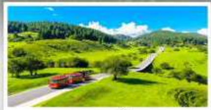
เวนางฟ้า

เดินทางโดย: สายการบินฉงฉิ่งเจียงเป่ย์ (PN)