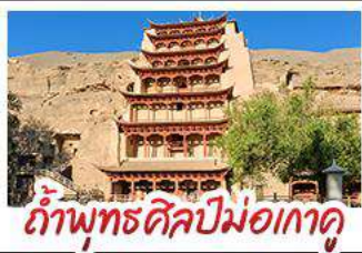
กำแพงม่อเถาคู

เป็นทรายครวญ - สระน้ำงพระจันทร์ ทะเลสาบเกลือฉางช่า - กำพุทศศิลป์ม่อเถาคู หุบเขาสายรุ้งจางเย่ - ทะเลสาบซิงไห่