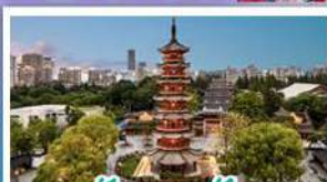
วัดเลงหยวน