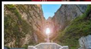
เขาประตูสวรรค์