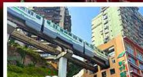
รถไฟทะลุคัง