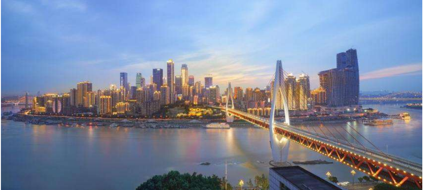
ที่พัก VIENNA HOTEL CHONGQING AIRPORT หรือเทียบเท่าระดับ 4 ดาว (มาตรฐานประเทศจีน)

23.50 น. เดินทางถึง ท่าอากาศยานนานาชาติสนามบินฉงชิ่ง เจียงเป่ย์ เมืองฉงชิ่ง "ฉงชิ่ง" มหานครที่ใหญ่ที่สุดทางภาคตะวันตกเฉียงใต้ของจีน ที่นี่ไม่ใช่แค่เมืองที่มีตึกสูงระฟ้า แต่เป็นเมืองที่เติบโตขึ้นตามแนวภูเขาและโอบล้อมด้วยสายน้ำอย่างน่าอัศจรรย์ ได้รับสมญานามว่า "เมืองแห่งภูเขา" ฉงชิ่งคือบทพิสูจน์ของความสามารถอันน่าทึ่งของมนุษย์ในการปรับตัวและสร้างสรรค์สิ่งก่อสร้างให้กลมกลืนไปกับธรรมชาติที่ท้าทายจากนั้นนำท่านผ่านขั้นตอนตรวจคนเข้าเมือง รับกระเป๋าสัมภาระ จากนั้นนำท่านออกเดินทางเข้าสู่ที่พัก