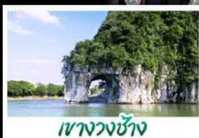
เขาวงชาง