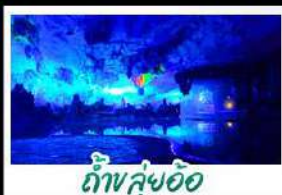
ถ้ำหยู่อ้อ

ไฮไลท์ ภาพเรือ+สะพานแดง - ล่องเรือแม่น้ำหลีเจียง หน้าบันไดสีทองอร่าม - กำแพงหยู่อ้อ - ภูเขาหวงชาง เจดีย์เงินเจดีย์ทอง - รถไฟความเร็วสูง เมฆพิเศษ บุปผาฟ้าย่างบาร์บิวูว์ ปลายอบเบียร์ เผือกคริสตัส สุกี้หืด