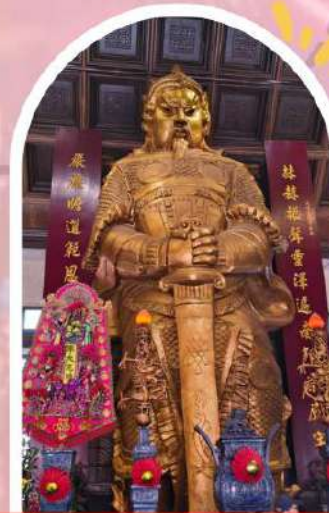
วัดเซกวง ขอพรโชคลาภ การเงิน และธุรกิจ