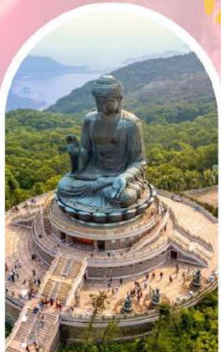
นั่งกระเช้ามองปีง นมัสการพระใหญ่โป่วหลิน