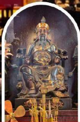
วัดปักโต

ขอเทพเจ้ากวนอู ความซื่อสัตย์ เงินทอง ธุรกิจมั่นคง