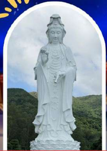
วัดชีซาน