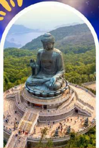
นั่งกระเชานองปิง