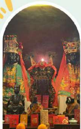
วัดหมิ่นโหมว