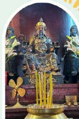
วัดปีกโตอองฮำ