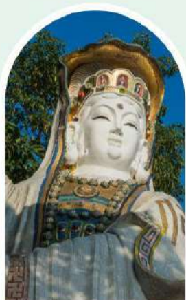
เจ้าแม่กวนอิม ธิพลสัย