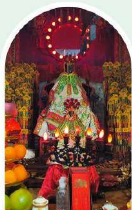
วัดเจ้าแม่กวนอิมอองฮำ