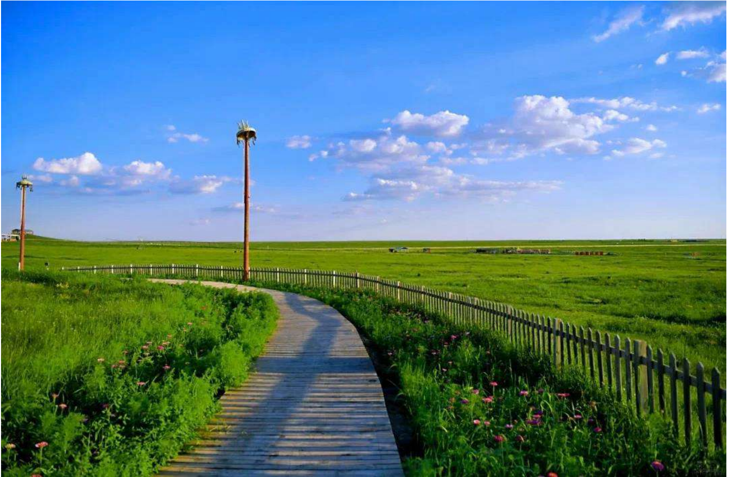
กลางวัน รับประทานอาหารกลางวัน ณ ภัตตาคาร (มือที่ 2)

ตั้งอยู่ท่ามกลางเนินเขาลูกคลื่นที่เป็นไปหลายสิบล้านไมล์ ราวกับผืนผ้าเขียวขจีที่ไม่มีที่สิ้นสุด การจัดวางเต็นท์มองไกล 399 หลังรอบๆ เต็นท์ทองคำหลวง 2 หลัง สร้างผังแบบ "นกอินทรีกางปีก" ที่สวยงามและสมมาตร ภูมิอากาศที่แห้งแล้งสร้างท้องฟ้าใสราวกับใบหน้าของเทพเจ้า ทำให้ทุกช่วงเวลาที่นี่เต็มไปด้วยแสงแดดอันอบอุ่นและลมเซาๆ ที่พัดผ่านใบหญ้าอย่างอ่อนโยน กิจกรรมต่างๆ ที่นี้จะทำให้ท่านได้สัมผัสทั้งความตื่นเต้นและความสงบ