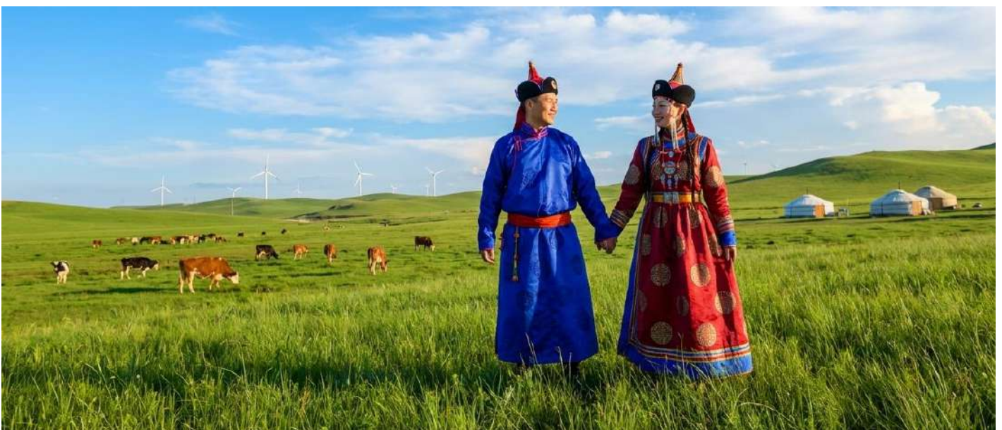
บ่าย นำท่านเข้าร่วมกิจกรรม สวมชุดแบบมองไกล สัมผัสพลังแห่งบรรพบุรุษ สวมเสื้อคลุมแบบดั้งเดิมที่มีสีสันสดใส ปักลวดลายอันประณีต คุณจะสัมผัสได้ถึงพลังแห่งบรรพบุรุษที่เคยปกครองดินแดนครึ่งโลก การสวม