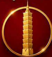
เสริมดวงเศรษฐี