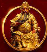
ขอพรเทพเจ้ากวนอู

เปิดดวงเศรษฐี เสริมดวงจ๋วยที่ได้หัววัน ขอพรเทพกวนอู รับพลังบารมีเจ้าแม่มาจู่ 4 วัน 3 คืน