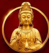
รับพลังบารมีเจ้าแม่มาจู่