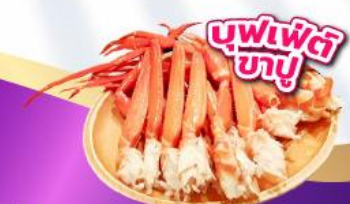
บุฟเฟ่ต์ ภูเขา