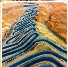
ถนนผานหลงกู่ดาว