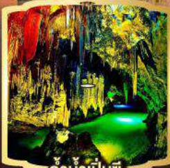
ถ้ำน้ำเป็นซี