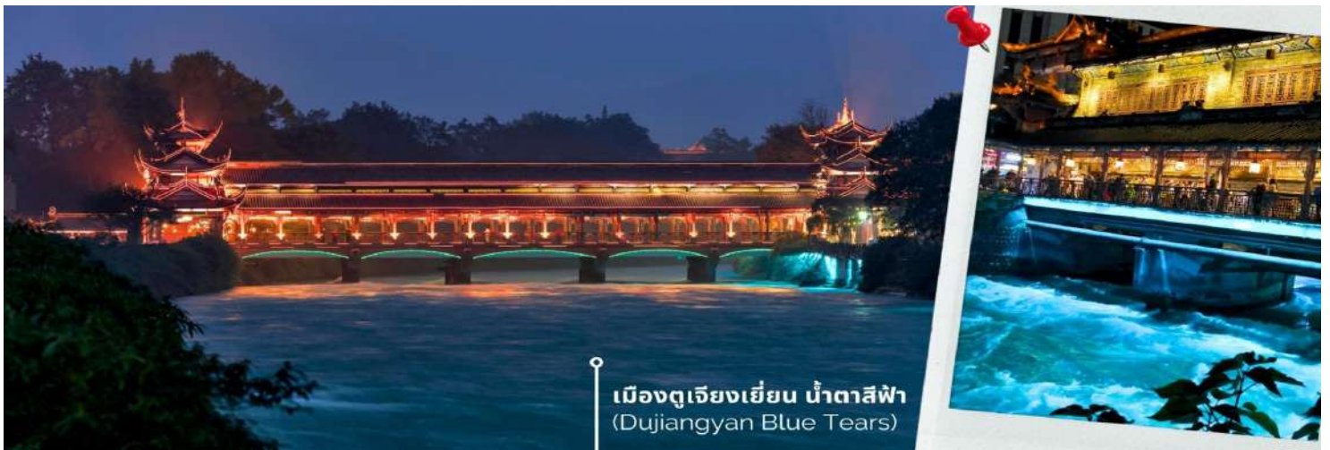
เมืองตูเจียงเยียน น้ำตาสีฟ้า (Dujiangyan Blue Tears)