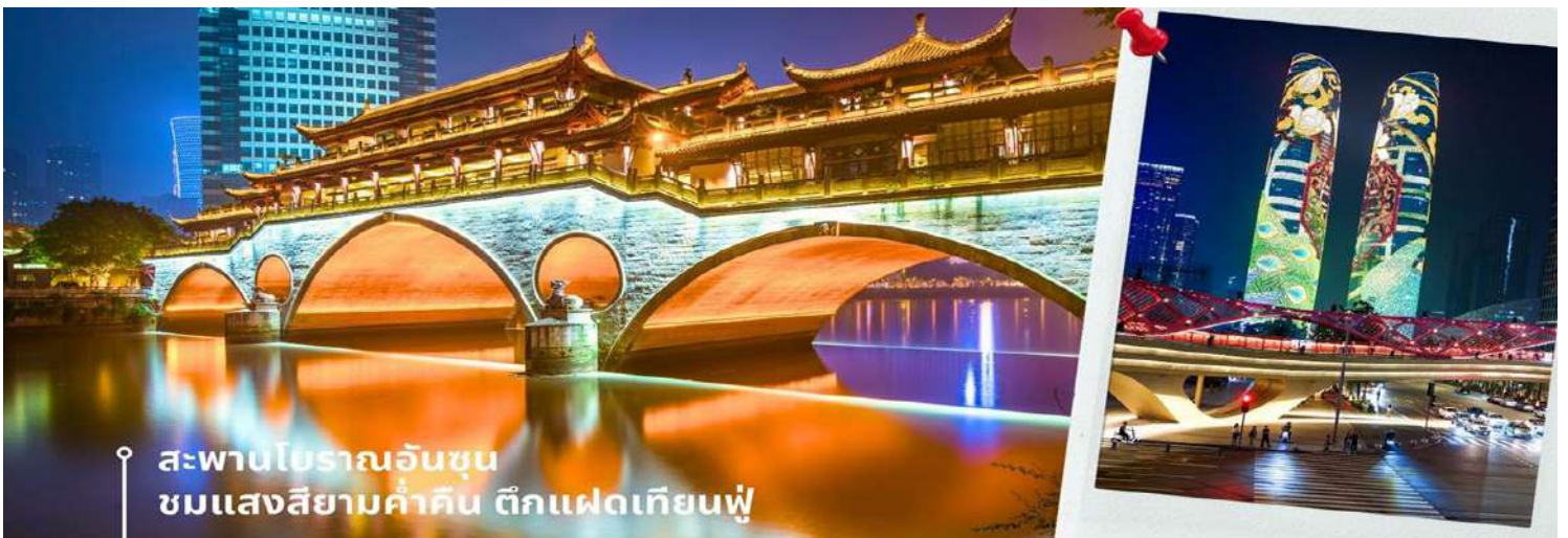
🇹🇼 นำท่านเดินทางเช้าที่พัก AC HTL MARRIOTT 4 ดาวหรือเทียบเท่า

นำท่านชม สะพานโบราณอันชุน-พร้อมชมแสงสียามค่ำคืน ตึกแฝดเทียนฟู เป็นสะพานข้ามคลองที่สร้างเป็นเหมือนอาคารอยู่ข้างบน ในช่วงเวลายามเย็นจะเป็นช่วงที่ผู้คนออกมาชมบรรยากาศบริเวณของสะพานแห่งนี้ และมีร้านค้ามากมาย รวมไปถึงบาร์เครื่องดื่มต่างๆ ที่ดึงดูดนักท่องเที่ยวได้เป็นอย่างดี เป็นสะพานที่ทอดข้ามแม่น้ำจินเจียง และเป็นรูปแบบสะพานมีหลังคา ตามลักษณะสถาปัตยกรรมจีนโบราณ อายุมากกว่า 300 ปี และในบริเวณใกล้เคียง ที่ตั้งของ ตึกแฝดเทียนฟู โดยในช่วงค่ำเวลา ประมาณ 19.00-22.00 น. ทั้ง 2 ตึกจะเป็นไฟ LED สวยงามโดดเด่นมาก ตึกแฝดเทียนฟู หรือที่เรียกอย่างเป็นทางการว่าตึกศูนย์การเงินนานาชาติเทียนฟู เป็นตึกระฟ้าที่สวยงามโดดเด่นสองตึกในย่านการเงินของเฉิงตู ตึกแต่ละตึกมีความสูง 58 ชั้นและสูงกว่า 700 ฟุต ตึกเหล่านี้โดดเด่นเป็นพิเศษด้วยภายนอกที่หุ้มด้วยไฟ LED ที่เป็นเอกลักษณ์ ซึ่งเปลี่ยนอาคารให้กลายเป็นจอภาพดิจิทัลขนาดใหญ่