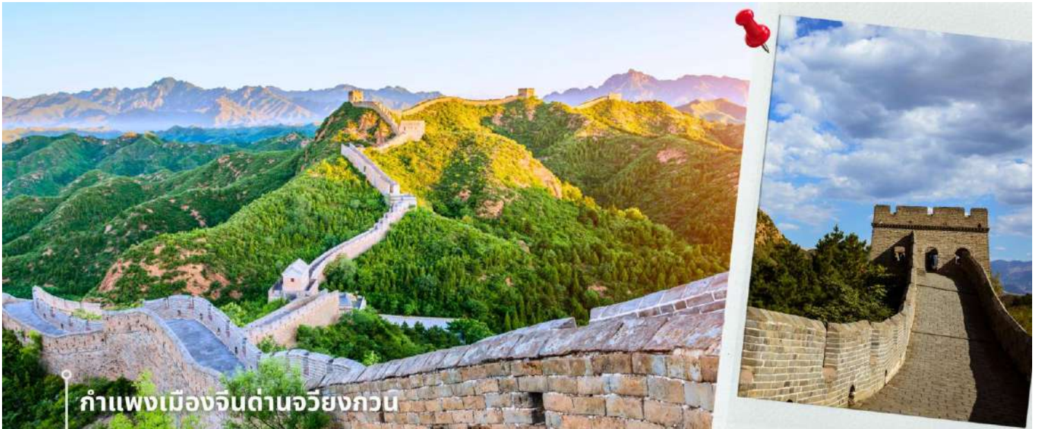
กำแพงเมืองจีนด้านจิวหยงกวน

กรุงปักกิ่งมีการรุกรานจากชนเผ่าเร่ร่อน ด้านจิวหยงกวนมีสถาปัตยกรรมที่สวยงามของศิลปะจีน จากยอดด้าน สามารถมองเห็นทิวทัศน์ที่สวยงามของเทือกเขาและธรรมชาติโดยรอบ นับว่าเป็น 1 ใน 8 จุดชมวิวที่มีชื่อเสียงของปักกิ่งมาตั้งแต่สมัยราชวงศ์จิ้น