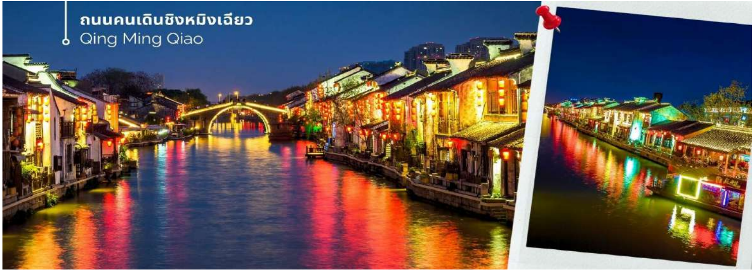
ถนนคนเดินชิงหมิงเฉียว Qing Ming Qiao

จากนั้นให้ท่านเดินชมบรรยากาศพื้นเมืองโบราณของ ถนนคนเดินชิงหมิงเฉียว เราจะได้เห็นบรรยากาศ บ้านเรือนสไตล์จีนโบราณ ร้านค้าต่างๆ ที่ขายสินค้าพื้นเมือง เสื้อผ้า ขนม ของประดับตกแต่ง ของฝาก ของที่ระลึกสวยๆ ให้เดินดูกันอย่างเพลิดเพลิน