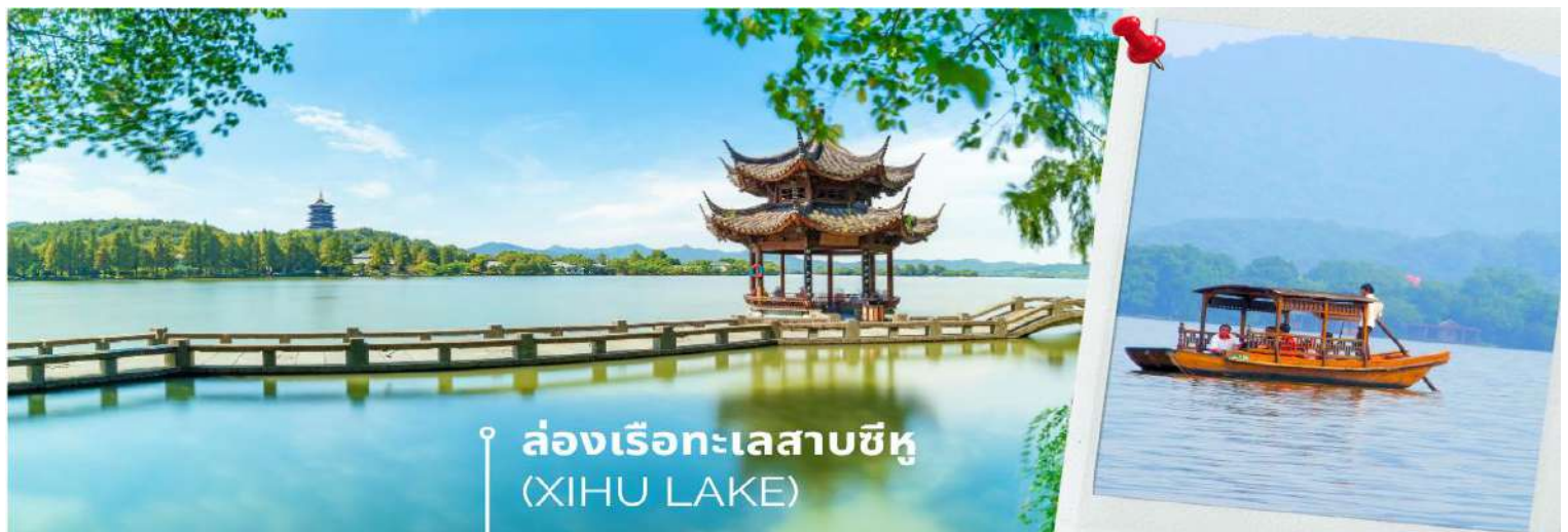
ล่องเรือทะเลสาบซีหู (XIHU LAKE)

นำท่านเดินทางสู่ เมืองหางโจว ใช้เวลาเดินทางประมาณ 2 ชั่วโมง (HANGZHOU) หรือ ฮังโจว เป็นเมืองที่ตั้งอยู่ในประเทศจีน ซึ่งตั้งอยู่ทางตอนตะวันออกของประเทศ เมืองหางโจวเป็นเมืองเก่าแก่ 1 ใน 6 ของประเทศจีน ปัจจุบันหางโจว ถือเป็นเมืองที่อยู่ในเขตภาคตะวันออกที่ได้รับการพัฒนาอย่างสูงสุดแล้ว ดังนั้นหางโจวจึงเป็นที่รู้จักกันเป็นอย่างดีว่าเป็นเมืองที่มีความสำคัญทางเศรษฐกิจ มีวัฒนธรรมที่ยาวนานและเป็นเมืองที่มีทัศนียภาพที่สวยงามเมืองหนึ่งของประเทศจีน นำท่าน ล่องเรือทะเลสาบซีหู (XIHU LAKE) ตั้งอยู่ในเมืองหางโจว ที่นี่สามารถล่องเรือชมความงามของทะเลสาบซีหูนอกจากทิวทัศน์อันงดงามแล้วทะเลสาบแห่งนี้ยังเป็นจุดเริ่มต้นเรื่องราวของ “นางพญางูขาว” ตำนานแห่งความรักสุดยิ่งใหญ่ที่ถูกนำมาทำเป็นภาพยนตร์และละครเวทีที่โด่งดังไปทั่วโลก เมื่อล่องเรือบนทะเลสาบซีหูนอกจากธรรมชาติอันงดงามของทะเลสาบแล้ว สิ่งที่น่าสนใจผู้มาเยือนทะเลสาบแห่งนี้คงหนีไม่พ้น เจดีย์นางพญางูขาว หรือ