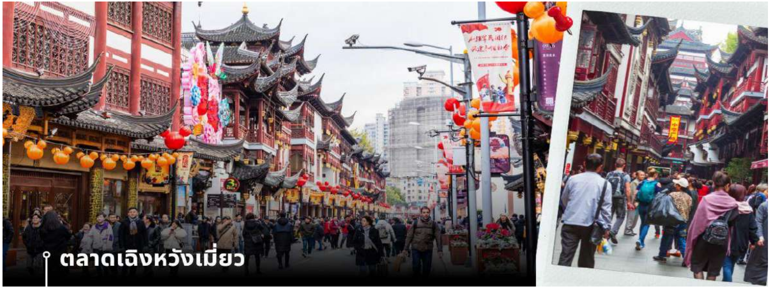
ตลาดเจิ้งหวังเมี่ยว

จากนั้นนำท่านสู่ ตลาดเจิ้งหวังเมี่ยว เป็นศูนย์รวมสินค้า และอาหารพื้นเมืองที่แสดงถึงเอกลักษณ์ของชาวเซี่ยงไฮ้ซึ่งมีการผสมผสานระหว่างอดีตและปัจจุบันได้อย่างลงตัว ซึ่งเป็นย่านสินค้าราคาถูกที่มีชื่ออีกย่านหนึ่งของนครเซี่ยงไฮ้ ให้ท่านอิสระช้อปปิ้งตามอัธยาศัย