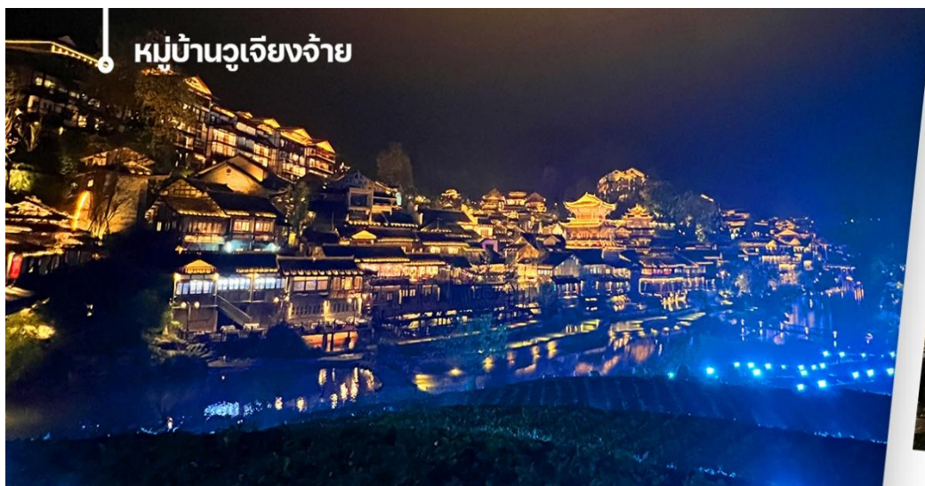
หมู่บ้านวูเจียงจ้าย

กลางวัน 📍 บริการอาหารกลางวัน ณ ภัตตาคาร (5) จากนั้นนำท่านเดินทางสู่หมู่บ้านวูเจียงจ้าย (Wujiang Zhai) เป็นหมู่บ้านโบราณในมณฑลกุ้ยโจว ประเทศจีน ที่มี ความสำคัญทางวัฒนธรรมและเป็นที่ตั้งถิ่นฐานของชนเผ่าตังและชนเผ่าม้ง หมู่บ้านแห่งนี้ตั้งอยู่ในหุบเขากลางที่รายล้อม