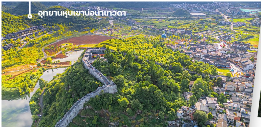
อุทยานหุบเขาบ่อน้ำเทวดา

เช้า 📍 บริการอาหารเช้า ณ ห้องอาหารของโรงแรม (4) นำท่านเดินทางไป อุทยานหุบเขาบ่อน้ำเทวดา หรือ หุบเขาเสินฉวน (รวมรถแบตเตอรี่) เป็นแหล่งท่องเที่ยวที่คุณจะได้สัมผัส ต่ำกับธรรมชาติ ให้ท่านได้ใช้คอนิที่จุดชมวิวหุบเขาเสินฉวน ตั้งอยู่ท่ามกลางธรรมชาติที่อุดมสมบูรณ์สวยงามในเขต ปกครองตนเองชนกลุ่มน้อยเผ่าเหมียวและปู้อี้ ฉียนหนาน ดึงดูดให้นักท่องเที่ยวผู้ชื่นชอบธรรมชาติจากทั่วทุกสารทิศ อยากรจะมาเยือนหุบเขาแห่งนี้ (รวมค่าขึ้นสะพาน SKYWALK ไว้ในรายการแล้ว)ให้ท่านได้เก็บภาพประทับใจได้เต็มที่