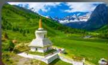
กุเวาสีครุณี