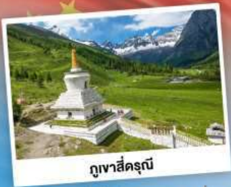
กู๋เจาสื่อตรุณี

เที่ยว 2 อุทยาน กู๋เจาสื่อตรุณี & ปี้เฉิงโกว เดินชมหมีแพนด้าสุดน่ารัก ใกล้ชิดกับแพนด้าแดง