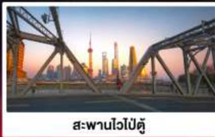
สะพานไวไป่ตู้