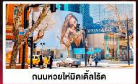
ถนนหวยไห่มีดเคิลโรด