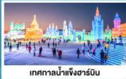
เทศกาลน้ำแข็งฮาร์บิน