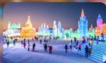
เทศกาลน้ำแข็งฮาร์บิน