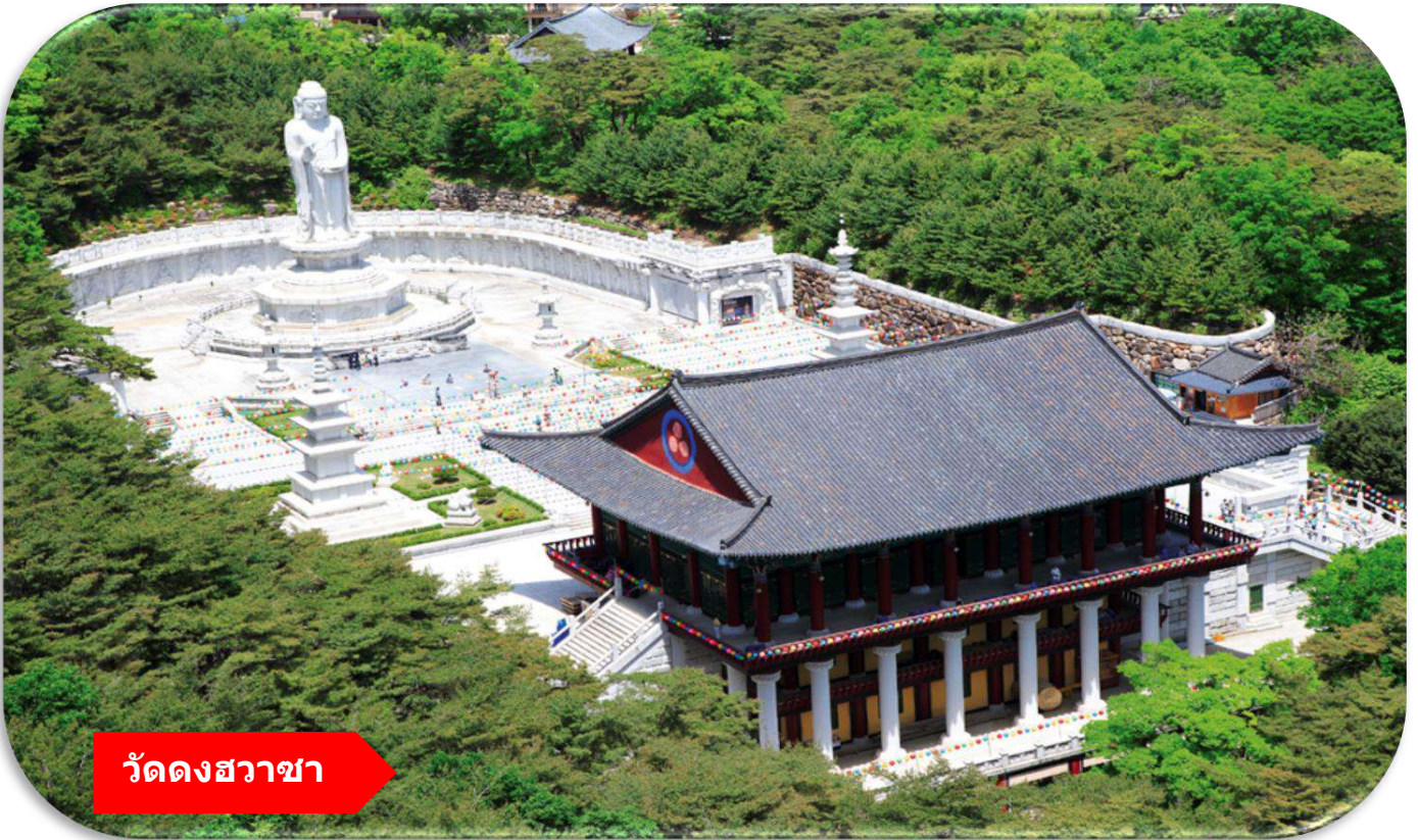
วัดดงสวาชา