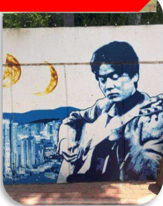
ถนนคิมควังซอก

นำท่านเที่ยวชม ถนนคิมควังซอก เป็นถนนสายเล็ก ๆ สดอบอุ้นในเมืองแทกู ที่สร้างขึ้นเพื่อระลึกถึง คิมควังซอก นักร้องโฟล์กในตำนานของเกาหลีใต้ ผู้เกิดที่แทกูและเป็นศิลปินที่คนเกาหลียังคงรักมากจนถึงทุกวันนี้ เดิมทีบริเวณนี้เป็นกำแพงเก่าใต้ทางรถไฟ แต่ภายหลังถูกพัฒนาให้กลายเป็น "ถนนแห่งเสียงเพลงและความทรงจำ" ตลอดทางจะเต็มไปด้วยภาพวาดกราฟฟิตี้ รูปปั้นของคิมควังซอก งานศิลปะและมุมถ่ายรูปแนววินเทจ เส้นห์ของถนนนี้ไม่ใช่ความอลังการ แต่เป็นความรู้สึก "อบอุ่นและมีเรื่องราว" คาเฟ่ ร้านดนตรี และบรรยากาศย้อนยุค