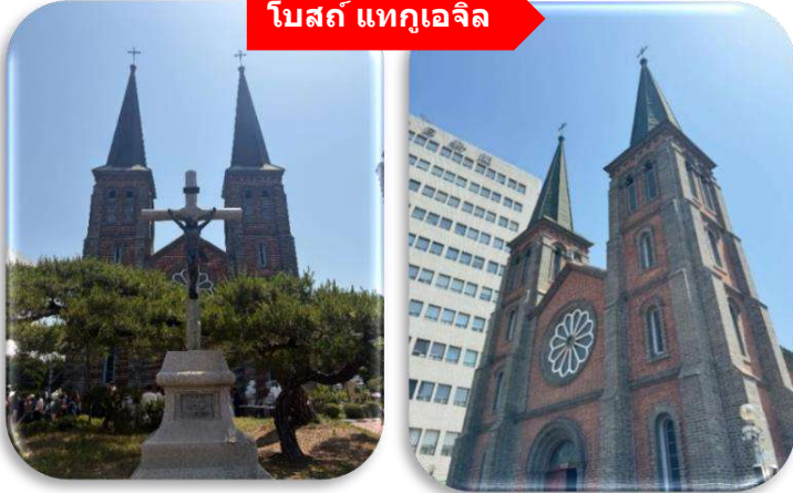
โบสถ์ แทกูเจ็ล

นำท่านเที่ยวชม โบสถ์แทกูเจ็ล โบสถ์นิกายโปรเตสแตนต์ที่เก่าแก่ที่สุดใน จังหวัดคย็องซังบุก (Gyeongsangbuk-do) ตั้งอยู่ในบริเวณ Cheongna ซึ่งเป็นย่านที่อยู่อาศัยของเหล่ามิชชันนารีที่มาอาศัยอยู่ใน เมืองแทกู