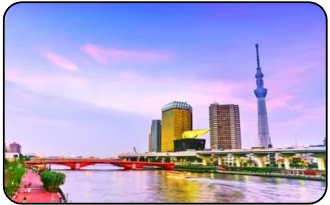
แม่น้ำซูมิดะ

สักการะ วัดมัตสึจิยามะโชเด็น หรือ “วัดหัวไชเท้า” ซึ่งเป็นวัดเก่าแก่ในย่านอาซากุสะ เป็นวัดเก่าแก่ในย่านอาซากุสะ กรุงโตเกียว ตั้งอยู่บนเนินเขาเล็ก ๆ ริมแม่น้ำซูมิดะ จุดเด่นคือเป็นวัดที่ขึ้นชื่อเรื่อง “ขอพรด้านการเงิน” โชคลาภ และความสำเร็จในธุรกิจ ส่วนไฮไลต์สำคัญของวัดนี้คือ ไคคอน หรือหัวไชเท้า สัญลักษณ์ศักดิ์สิทธิ์ คนที่นี้เชื่อว่าไคคอนช่วย “ชำระล้างสิ่งไม่ดี” และนำโชคลาภเข้ามา นักท่องเที่ยวมักนำไคคอนไปถวายเพื่อขอพร