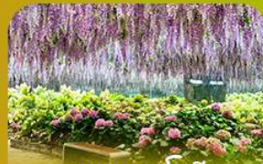
สวนนกเป๊กนือ