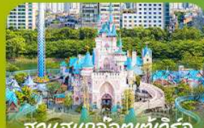
สวนสนุกแก๊งอเตเช่เวิร์ล Lotte Adventure World